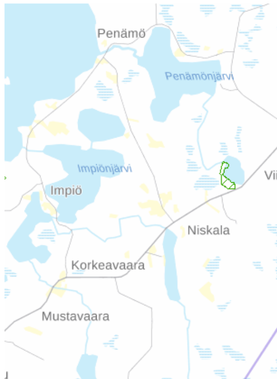
Kuva 4. Ranta-asemakaava-alueen sijoittuminen.