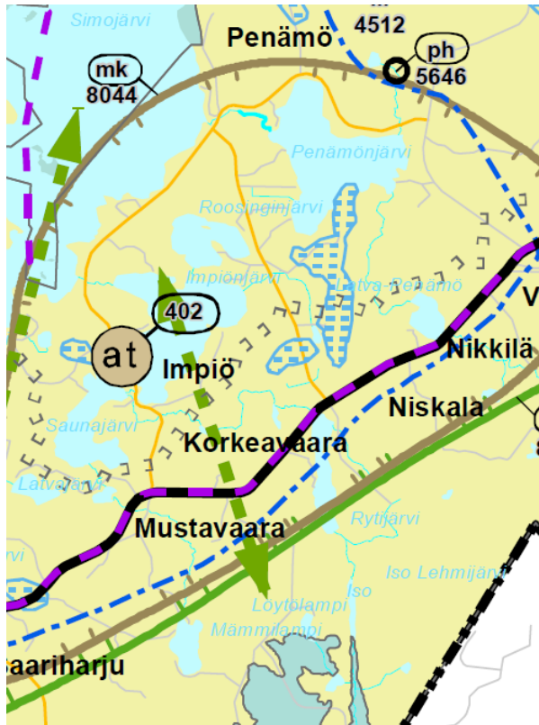
Kuva 2. Ote Rovaniemen ja Itä-Lapin maakuntakaavasta (2022).