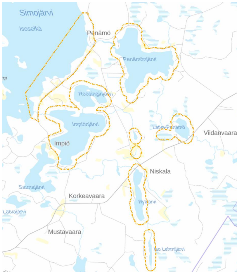
Kuva 1. Suunnittelualueen likimääräinen rajaus.