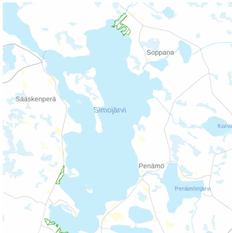
Kuva 4. Ranta-asemakaava-alueiden sijoittuminen.

Ranta-asemakaavojen sijainnit ilmenevät oheisesta kartasta.