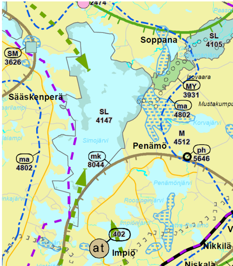
Kuva 2. Ote Rovaniemen ja Itä-Lapin hyväksytystä maakuntakaavasta (2022).